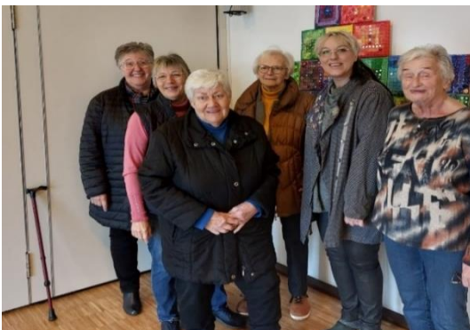
Ihre Kerzenfrauen von St. Clemens